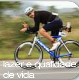
lazer e qualidade de vida