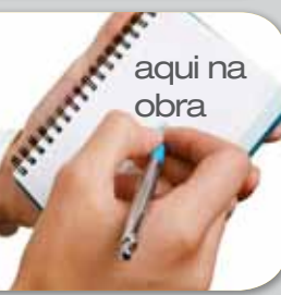
aqui na obra