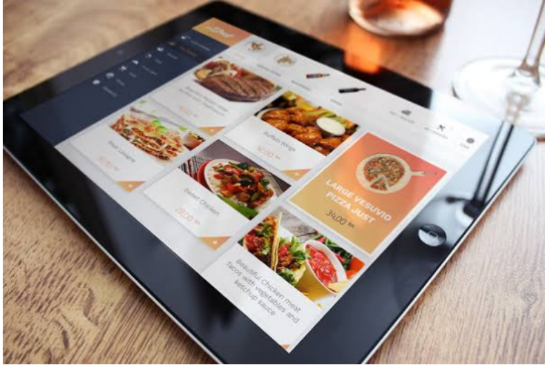
Self Order Tablet