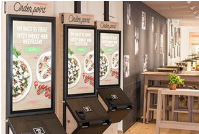
Self Order Kiosk