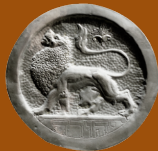
LEÓN, SÍMBOLO DE JUDÁ | Motivo repujado en las puertas del Hospital Bikur Jolim, Jerusalén

PARA RECONSTRUIR EL PASADO SE CONSULTADO VIEJOS DOCUMENTOS, ENTRE ELLOS LA BIBLIA, UNO DE LOS LIBROS MÁS ANTIGUOS REGISTRADOS. LA RELIGIÓN REPRESENTA UN TEMA DE DEBATE CONSTANTE QUE POR SIGLOS HA MOVIDO MASAS E INSTITUCIONES, INTEGRANDO VALORES QUE INFLUYEN EN LA SOCIEDAD, EN OCASIONES RIGIENDO SU COMPORTAMIENTO PERO MANTENIENDO UNIDAS A LAS NACIONES DE MANERA ESPIRITUAL.