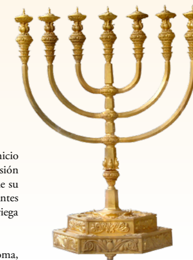
MENORÁH | Candelabro de la cultura israelita, su uso se remonta al pueblo hebreo acampado al pie del monte Sinaí y en su Éxodo rumbo a la Tierra Prometida, en tiempos de la Edad Antigua

Las normas inscritas en la también conocida Ley de Moisés, ayudaron a que se firmara un acuerdo que beneficiaba a los judíos en territorio romano, reconociéndolos como un grupo social diferenciado únicamente por sus creencias religiosas, incluso el emperador Herodes mandó a construir un segundo Templo en Jerusalén, obra que se concluyó en el año 62 d.C.