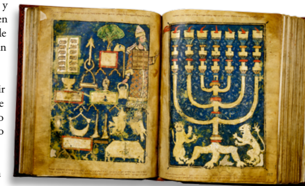
PENTATEUCO DE RATISBONA, BAVARIA, C. 1300 | Sacerdote de Israel con utensilios del Templo entre los que destaca el menoráh