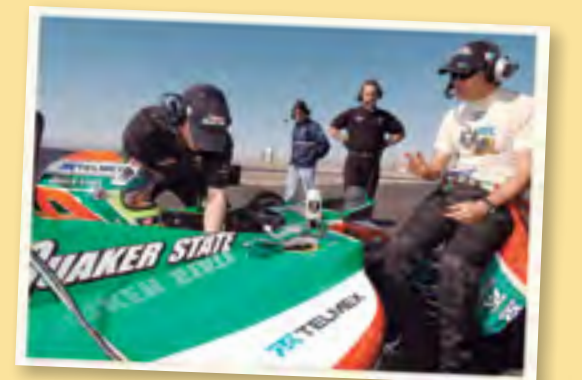
▲ CARLOS SLIM RECIBIENDO INSTRUCCIONES DEL PILOTO ADRIÁN FERNÁNDEZ, PREVIO A RODAR EL BÓLIDO REYNARD DE FERNÁNDEZ RACING, ESCUADRA PATROCINADA POR TELMEX EN 2001

También participa de manera activa en programas de ayuda, ejemplo de ello Fundación Telmex, la cual impulsa sectores como educación, salud, desarrollo humano y justicia social, o los programas Pilotos por la Seguridad Vial y Corriendo para Cambiar Historias , entre otros proyectos humanitarios donde se integran acciones que benefician a las personas menos favorecidas.