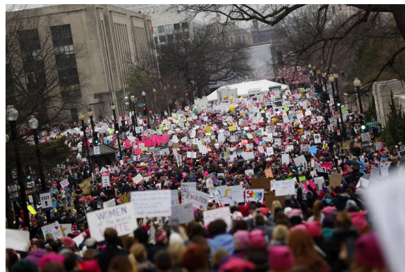
ประชาชนเข้าร่วม Women's March อย่างคับคั่ง ในวอชิงตัน ดี.ซี. ประเทศสหรัฐฯ

Phumzile Mlambo-Ngcuka (กรรมการบริหาร UN Women), 2018