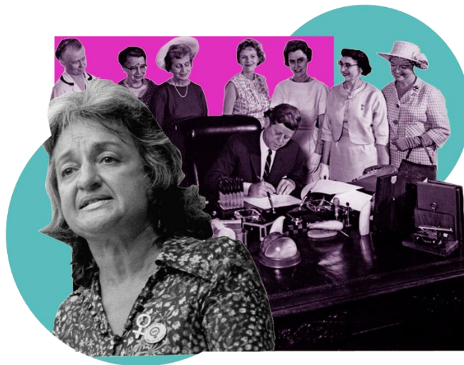
เบ็ตตี ฟรีดแมน ขณะกล่าวสุนทรพจน์ในปี 1966 และ ประธานาธิบดี จอห์น เอฟ. เคนเนดี