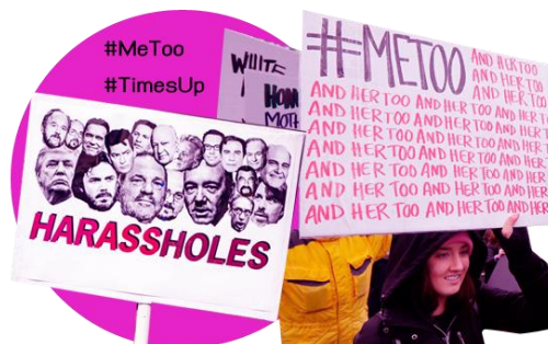
กระแส #MeToo ทำให้ผู้คนจำนวนมากออกมาเรียกร้องในเรื่องการคุกคามทางเพศ

และในขณะเดียวกัน การใช้โซเชียลมีเดียสามารถช่วยแพร่สะพัดข้อมูลข่าวสารได้อย่างรวดเร็ว ทำให้อินเทอร์เน็ตเป็นช่องทางหลักในการเรียกร้องสิทธิสตรี ปัจจุบันมีการสร้างความเคลื่อนไหวผ่านโซเชียลมีเดียอย่างกว้างขวาง และการเกิดแคมเปญเพื่อผู้หญิง โดยเฉพาะ #MeToo เป็นแฮชแท็กที่ผู้หญิงจำนวนมากกล้าออกมาเปิดโปงเรื่องราวที่ตนเองถูกล่วงละเมิดทางเพศ นอกจากนี้ยังมีแฮชแท็กสำคัญอื่น ๆ เช่น #BringBackOurGirls #YesAllWomen #EverydaySexis #WomenShould #HeForShe #TimesUp และ #FeministFriday เป็นต้น