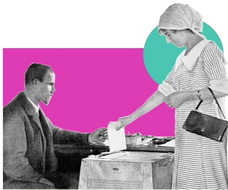
หญิงชาวฟินแลนด์ลงคะแนนเสียงเลือกตั้งครั้งแรกในปี 1906

1890s – 1940s คลื่นลูกที่ 1: การเรียกร้องเพื่อความเท่าเทียมของชายหญิง โดยเฉพาะสิทธิในการเลือกตั้ง ช่วงต้นศตวรรษที่ 20 (ค.ศ. 1900 – 2000) คำว่า Feminist ถูกใช้ร่วมกับกลุ่ม Suffragette (ซัฟฟราเจ็ตต์) หรือกลุ่มสตรีที่ปลุกระดมให้คนออกไปใช้สิทธิเลือกตั้ง เมื่อกลุ่ม Suffragette ประสบความสำเร็จ ต่อมาในปี 1893 นิวซีแลนด์เป็นประเทศแรกที่ให้สิทธิผู้หญิงในการเลือกตั้ง ตามมาด้วยประเทศออสเตรเลียในปี 1902 ประเทศฟินแลนด์ปี 1906 สหรัฐฯ ปี 1912 ส่วนประเทศอังกฤษได้ให้สิทธิผู้หญิงที่อายุมากกว่า 30 ปี สามารถเลือกตั้งได้ในปี 1918 แม้จะใช้เวลายาวนาน แต่นี่คือก้าวแรกที่สำคัญ อันส่งผลต่อการเปลี่ยนแปลงอื่น ๆ