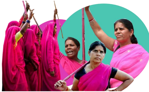
Gulabi Gang ในประเทศอินเดีย