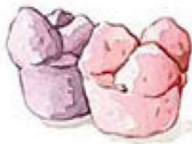
ขนมถ้วยฟู