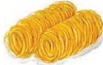
ขนมฟอยทอง