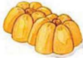
ขนมทองเอก