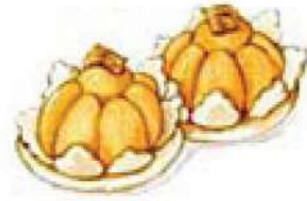
ขนมจำมงกุฎ