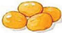
ขนมเม็ดขนุน