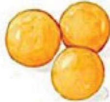
ขนมทองหยอด