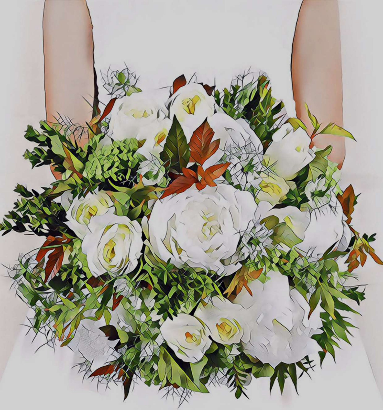
ภาพ ณีจรัสชญา วงคำปวน