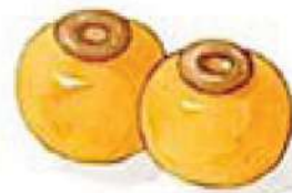
ขนมเสน่ห์จันทร์