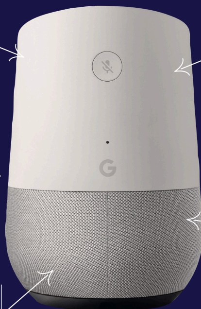
Google Home (environ 149 €)

Comme le moteur de recherche éponyme, l'enceinte Google cherche vos requêtes. Elle lance aussi des quiz de culture gé et même des blagues (pas toujours drôles).