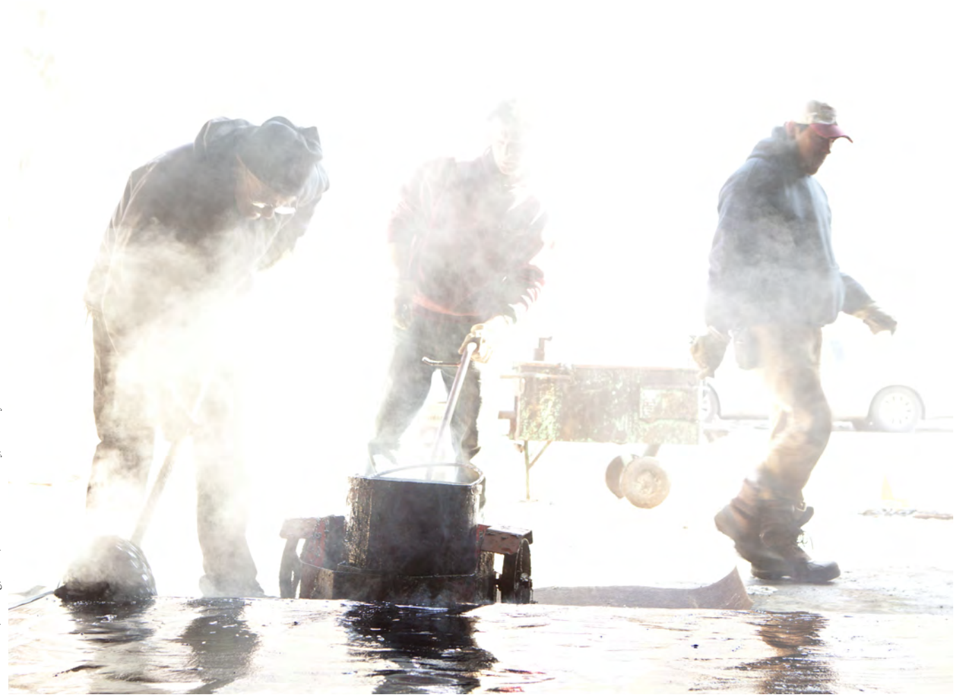
Theaster Gates, Tarring, 2013, Photo: Sara Pooley, Courtesy the artist

Tophane’de sanat mekanlarıyla mahalle sakinleri arasında süregelen sürtüşmeyi biliyorsunuz. Emlak piyasasının aktörleri, sanatçıların yerleştiği semtlerde fiyatları yükseltme eğiliminde olabiliyorlar. Bu durumdan asıl sanatçılar zarar görse de sanatın varlığı bu tip yerlerde tehdit unsuru gibi algılanmaya başladı. Hemen alt tarafında Karaköy ciddi bir değişim geçirirken Tophane’nin gençleri bu durumu