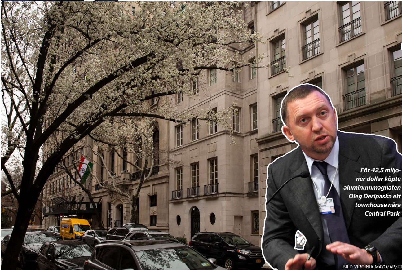
För 42,5 miljoner dollar köpte aluminummagnaten Oleg Deripaska ett townhouse nära Central Park.