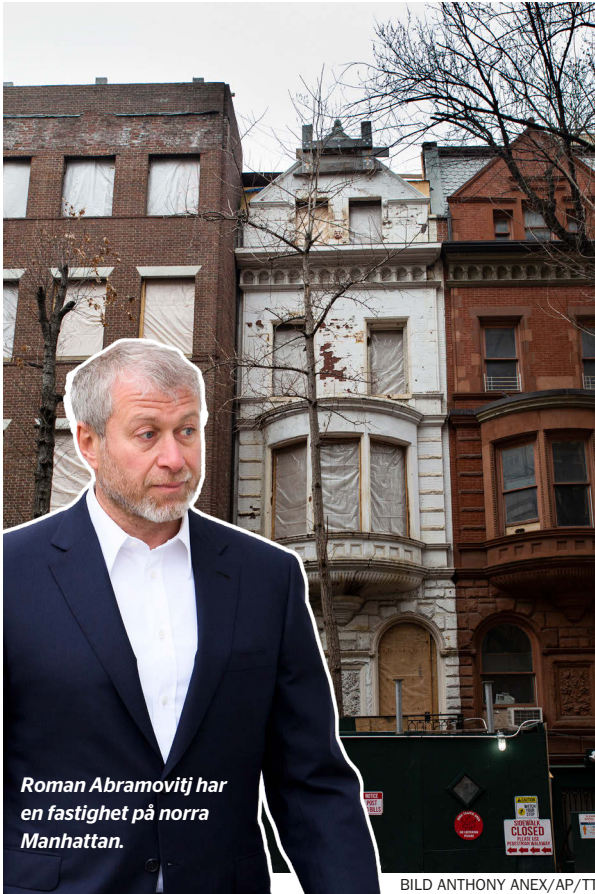
Roman Abramovitch har en fastighet på norra Manhattan.