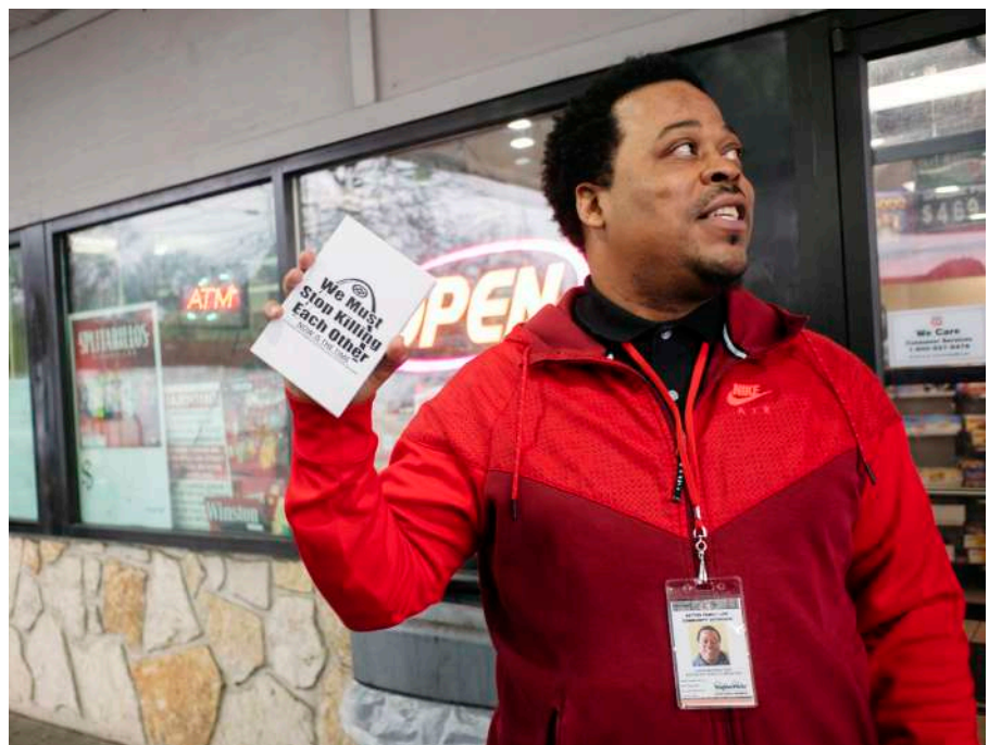
För en ljusare framtid

”Jag har en konflikt men den kommer inte gå att deeskalera. Jag kommer att döda den jäveln när jag ser honom”, fräser