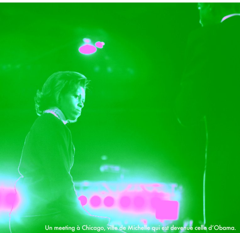
Un meeting à Chicago, ville de Michelle qui est devenue celle d'Obama.