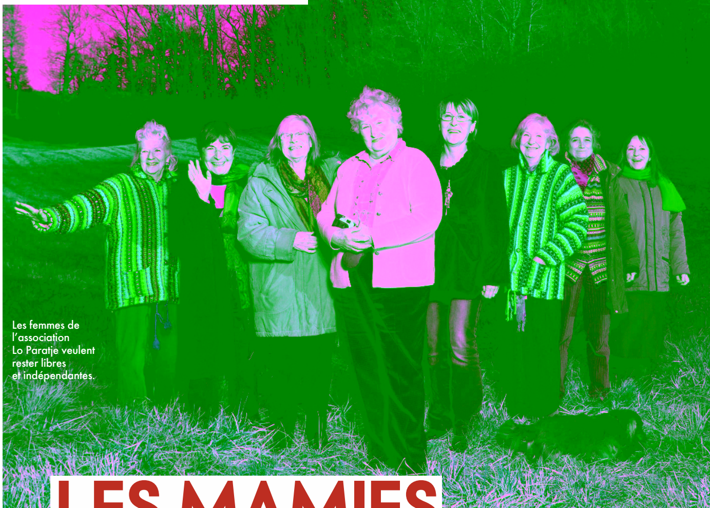
Les femmes de l'association Lo Paratje veulent rester libres et indépendantes.