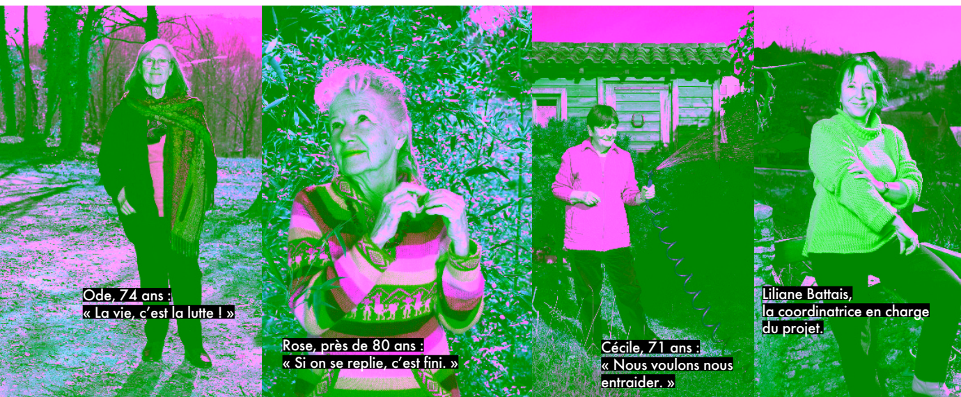
Ode, 74 ans : « La vie, c'est la lutte ! »

La belle Rose, qui a élevé ses quatre enfants au bio au gré des mutations de son gendarme de mari qu'elle a fini par quitter à la retraite, a déjà proposé au maire de Saint-Julien d'accueillir régulièrement des enfants du village. Son seul regret est que leur communauté ne soit pas intergénérationnelle. « Mais nous recevons nos petits-enfants et les jeunes du coin. Nous souhaitons participer à la vie de la collec-