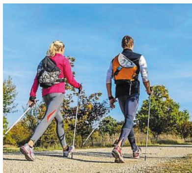
Cette 3 e édition de Courir ou marcher, dimanche, est ouverte à tous.

Tout au long de la matinée, il sera possible de se restaurer, des animations sont prévues sur le parcours. Il sera aussi possible de déguster et acheter des pommes issues des vergers Timmerman.