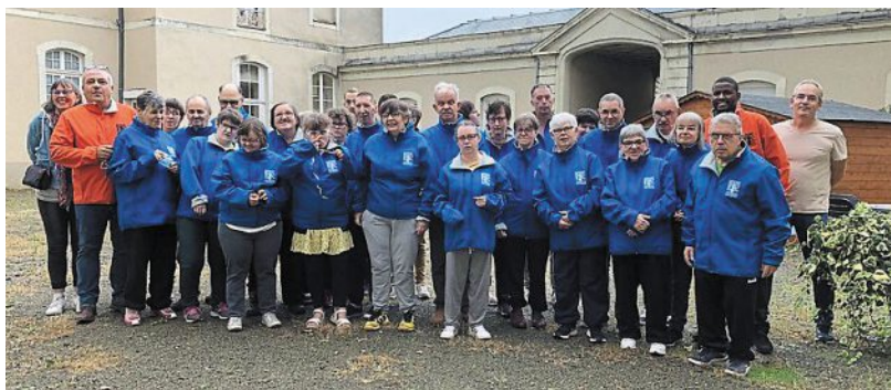
Les résidents du foyer Temps de vivre sont désormais bien équipés pour la pratique du sport.