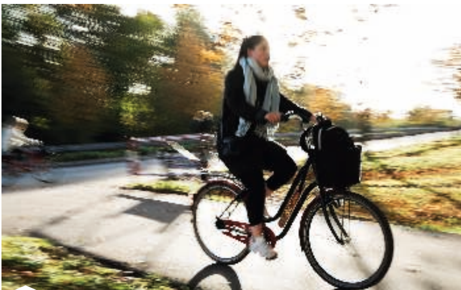
Tiltag som udlån af elcykler, tilbud om cykelservice og kampagner får flere til at vælge cyklen.

- Det virker, at vi italesætter transport, og at vi får fat i nogle ambassadører, som brænder for