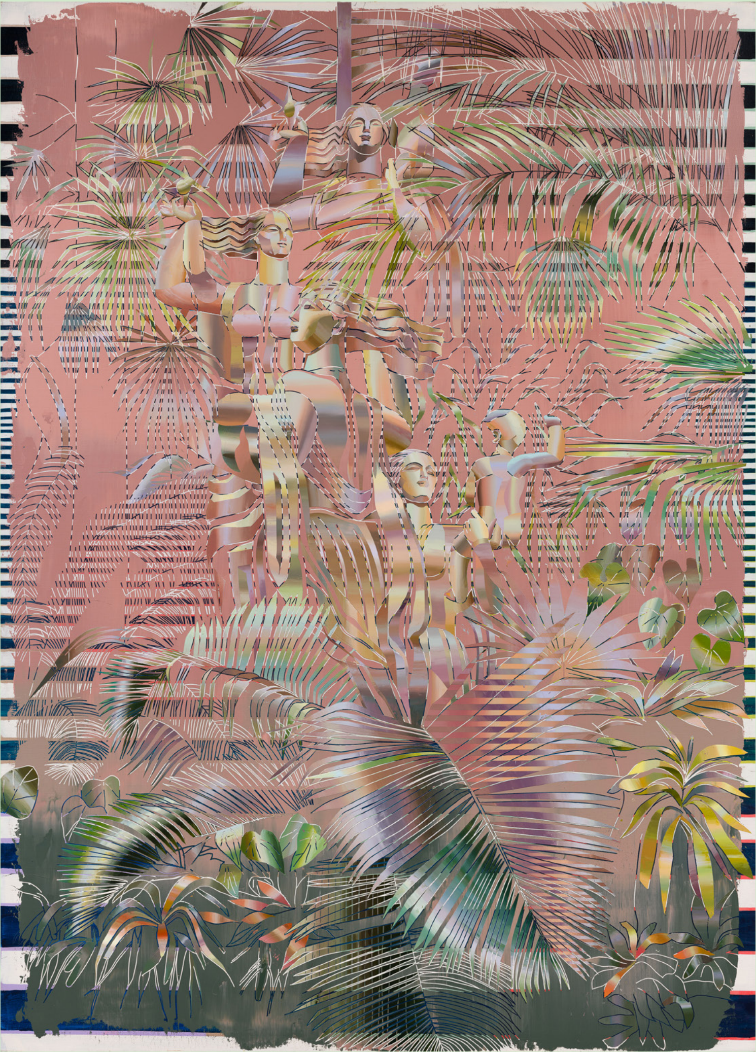
崔洁，《雕塑公园》，2023，布面丙烯 Acrylic on canvas, 250 x 180cm，图片由艺术家惠允。