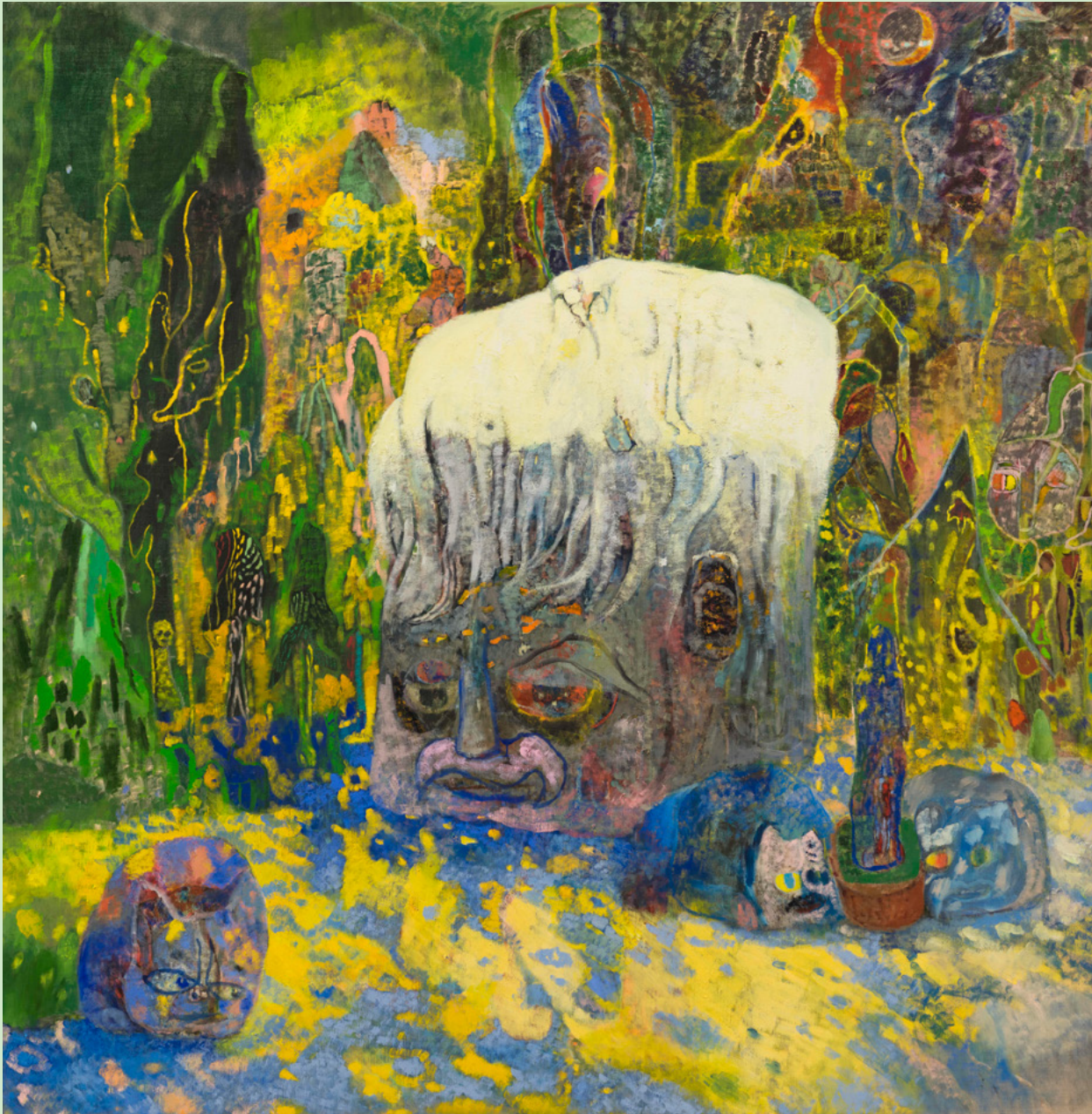
上：仇晓飞，《密林中的盆栽》，油彩画布，2022，180 × 180cm，© 仇晓飞，图片致谢艺术家及蓬皮杜艺术中心。 下：沈莘，《太阳轮》影像静帧，2024，超8毫米胶片转高清，单通道影音装置，26:52，图片致谢没顶画廊和艺术家。