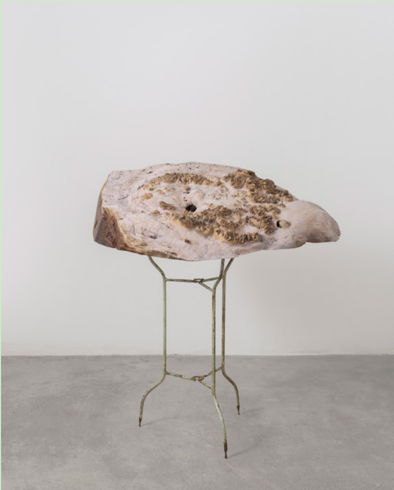
胡晓媛，《草刺 一》，2016，花梨木、墨、绡、漆、丙烯、旧铁架、铁钉、丝线，80 x 60 x 90 cm，图片致谢艺术家和北京公社。

在《DOKU 独生独死》之后，观者发现自己有回到了展览的起点：入与出、左转与右转的异同，终归于我们自身的选择和解读。“目 - 中国境象”试图超越线性时间逻辑，构建一种对话、交融、重叠的当代时空观，至此，一个轮回得以完成。