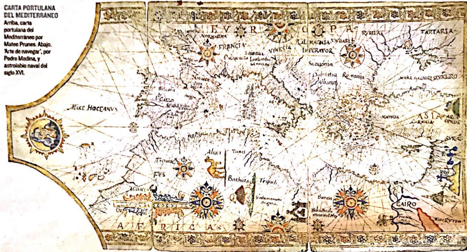
CARTA PORTULANA DEL MEDITERRANEO Arriba, carta portulana del Mediterráneo por Mateo Prunes. Abajo, 'Arte de navegar', por Pedro Medina, y astroabio naval del siglo XVI.