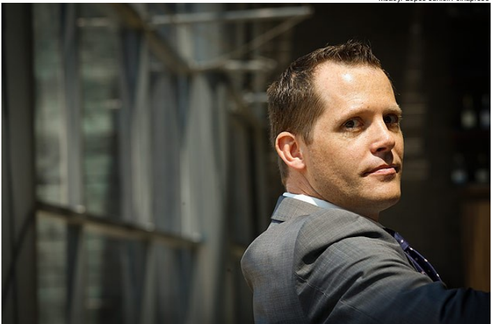
Moacyr Lopes Junior/Folhapress