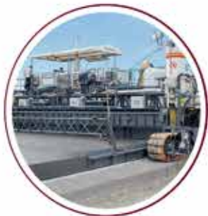
Wirtgen Slipform Paver 3 units Wirtgen Slipform Paver 3 unit