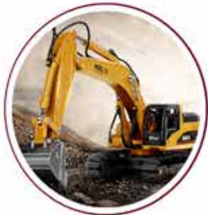
Excavator 30 units Excavator 30 unit