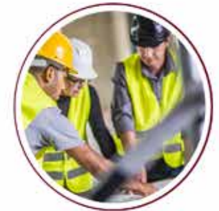
Our Team 250 personnels. Jumlah staff 250 orang

Professionally & periodically trained in construction sector Dilatih secara profesional & secara periodik di bidang konstruksi