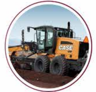
Motor Grader 5 units Motor Grader 5 unit