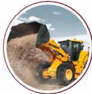
Bulldozer 15 units Bulldozer 15 unit