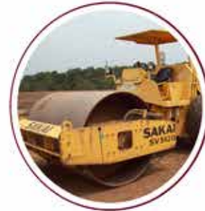
Vibro 15 units Vibro 15 unit