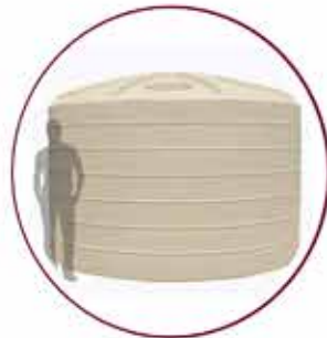
Water Tank 5 units Water Tank 5 unit