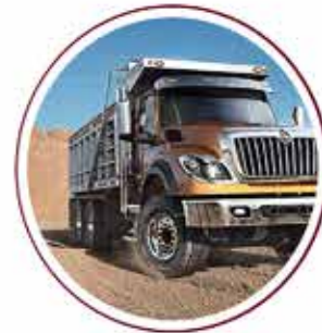
Dump Truck 150 units Dump Truck 150 unit