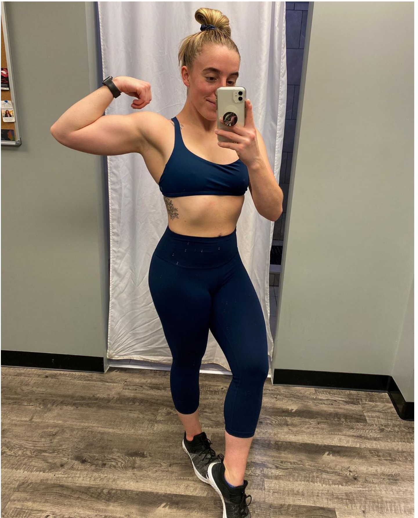
#gym #gainz #motivation #shredded #aesthetic #abs #mensphysique #competition #model #modeling #malemodel #fitnessmodel #musclemodel #photography #photo #photooftheday #instafit #instafitguy #instadaily #instame #fitfam #boy