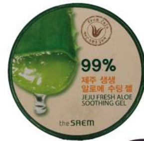
Soothing Gel The Saem

Tips for travelling.. "Jika pergi ke negara wilayah eropa, lotion menjadi hal yang sangat penting untuk menjaga kulit kita tidak kering dan tetap lembut."