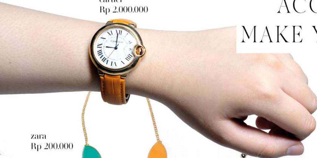
zara Rp 200.000