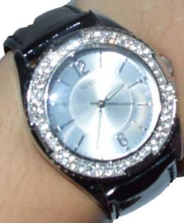
GUESS WATCH RP1.200.000