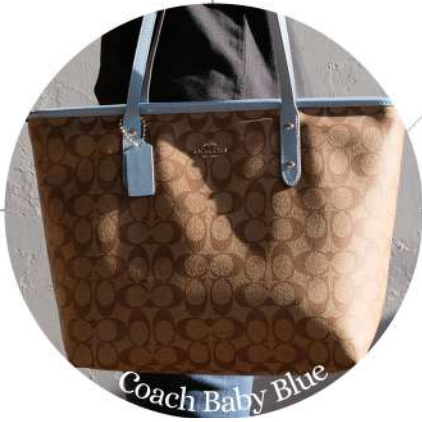
Coach Baby Blue