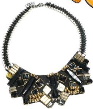
h&m Rp 100.000

Mengapa hanya satu bila Kamu bisa mendapatkan stimulus gaya andalan kamu yang lebih lewat aksesoris “plural”.