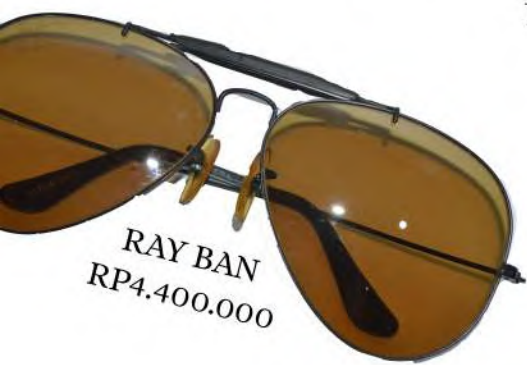
RAY BAN RP4.400.000