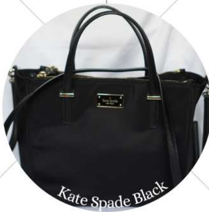
Kate Spade Black