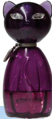
Parfum Katy Perry Purr

Destinasi favorit? "Saya senang ke Belanda, tempat dimana saya menerima gelar sarjana. Musim semi adalah musim favorit saya untuk berkunjung kesana, karena banyak bunga tulip bermekaran."