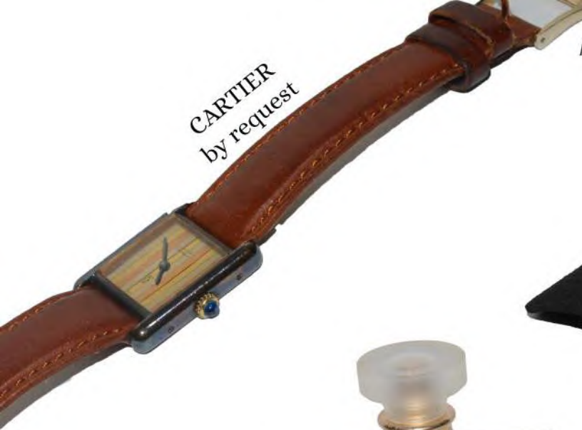
CARTIER by request