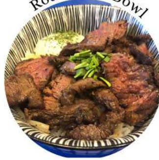
Roast Beef Bowl