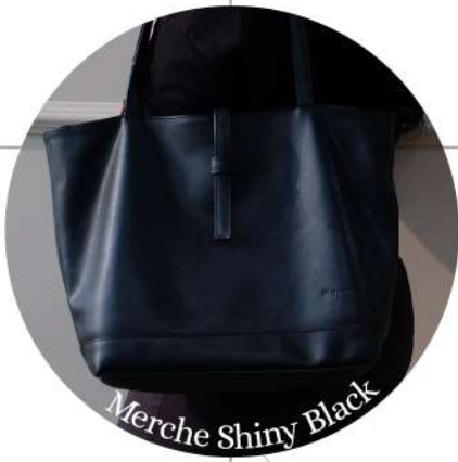
Merche Shiny Black

Ketika liburan ingin membawa satu tas saja? Tentunya bukan hal yang mustahil. Dengan membawa fit all in bags ini kamu tidak perlu khawatir lagi, karena barang-barangmu pasti muat untuk dibawa!