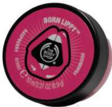
Lipbalm The Face Shop

Best place to shop? "Saya suka menelusuri kota Paris untuk berbelanja aksesoris branded seperti tas dan jam tangan."