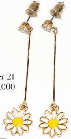
forever 21 Rp 55.000