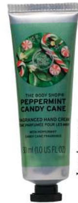
Hand Cream The Body Shop

What do you pack? "Pastinya skin-care products sebagai rutinitas saya setiap hari dan juga parfum untuk menjaga tubuh saya tetap harum dan segar."