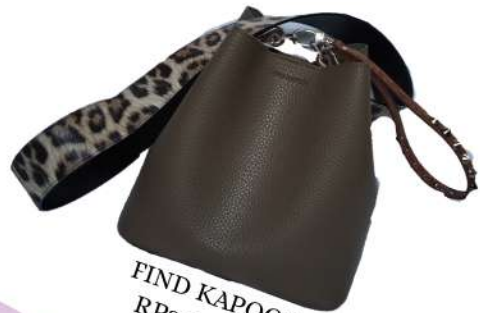
FIND KAPOOR RP2.500.000