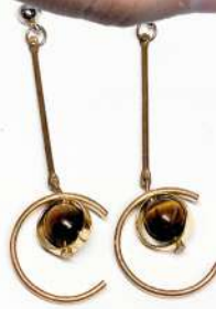
h&m Rp 50.000