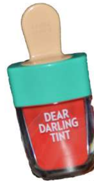
ETUDE LIPTINT RP100.000