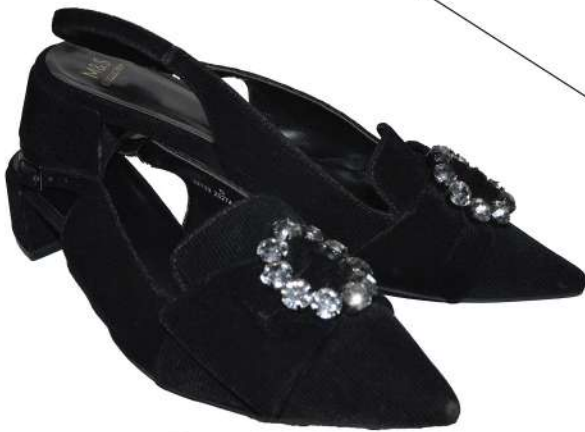
Marks & Spencer Rp700.000,-