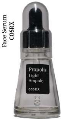
Face Serum COSRX

Esensial bagi traveller dalam berpegian dan istimewanya sebuah destinasi.