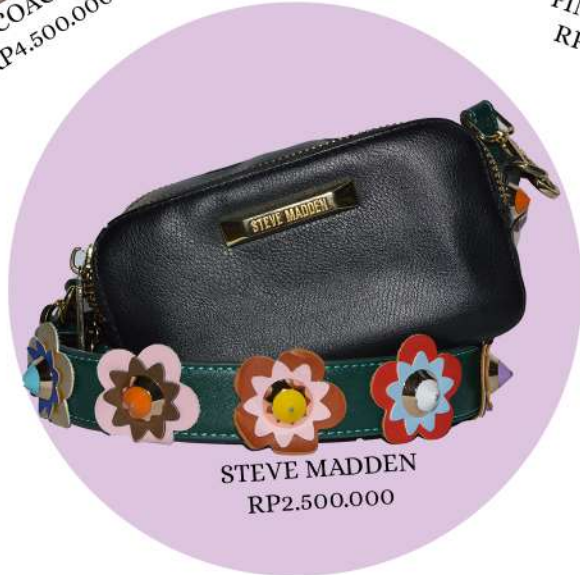
STEVE MADDEN RP2.500.000