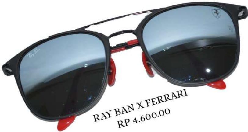
RAY BAN X FERRARI RP 4.600.00

barang barang penyelamat semasa liburan? tentunya merupakan barang yang utama masuk kedalam tas kita. seperti halnya barang barang dibawah ini! Take a not.