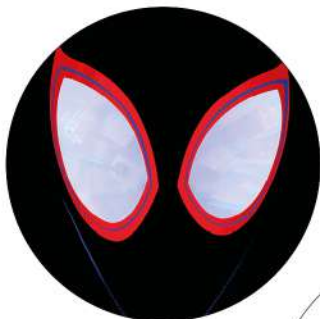
7. Sunflowers (Spiderman: Into The Spiderman-Verse)