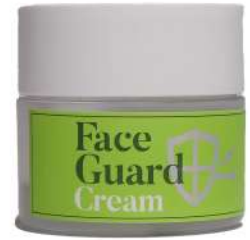
Face Guard Cream Mardah

What do you pack? "Pastinya skin-care products sebagai rutinitas saya setiap hari dan juga parfum untuk menjaga tubuh saya tetap harum dan segar."