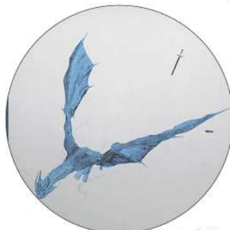
6. Wow. Post Malone