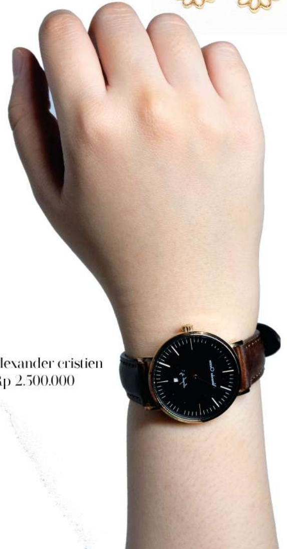
alexander cristien Rp 2.500.000

Jam tangan akan menambahkan kesan elegant saat kamu pergi liburan.