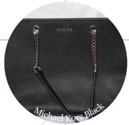
Michael Kors Black