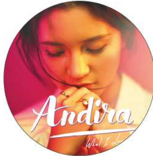
10. Menghilang Andira