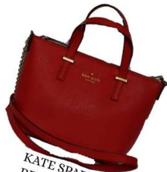
KATE SPADE RP3.000.000