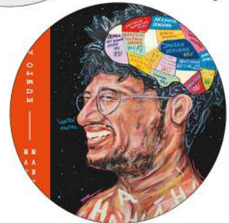
3. Konon Katanya