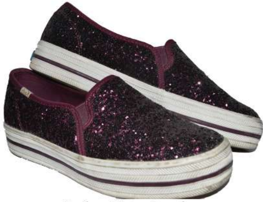
Keds x Kate Spade Rp1.500.000,-