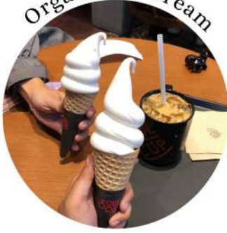
Organic Ice Cream