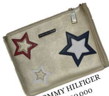
TOMMY HILFIGER RP1.700.000