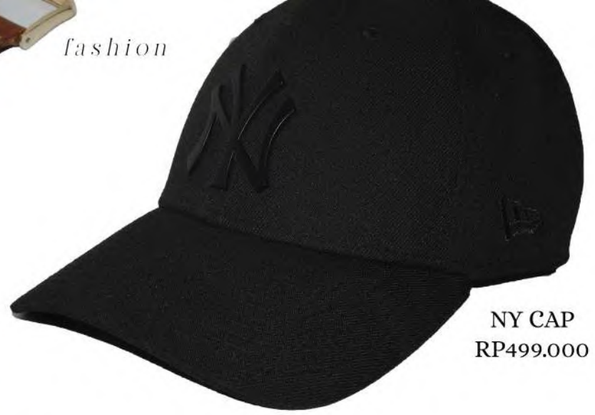
NY CAP RP499.000