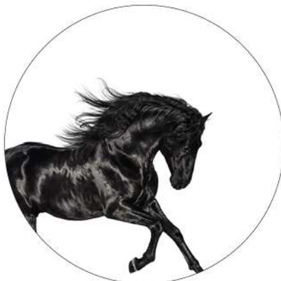
1. Old Town Road Lil Nas X Feat. Billy Ray Cyrus