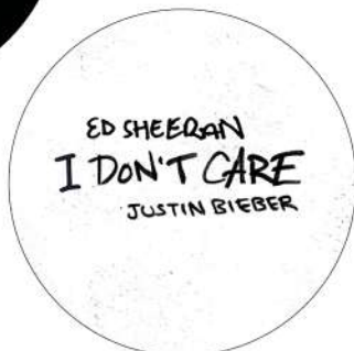
5. I Don't Care Ed Sheeran Feat. Justin Bieber