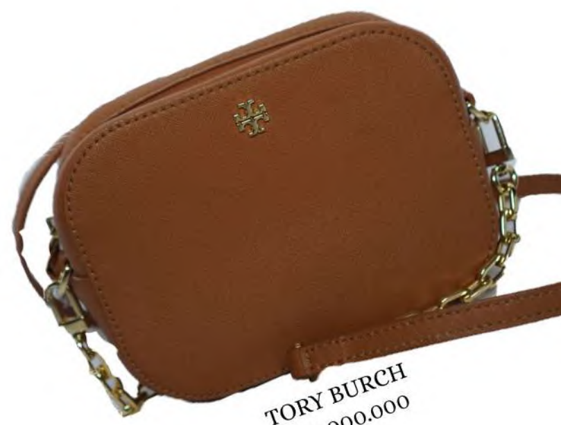
TORY BURCH RP3.000.000