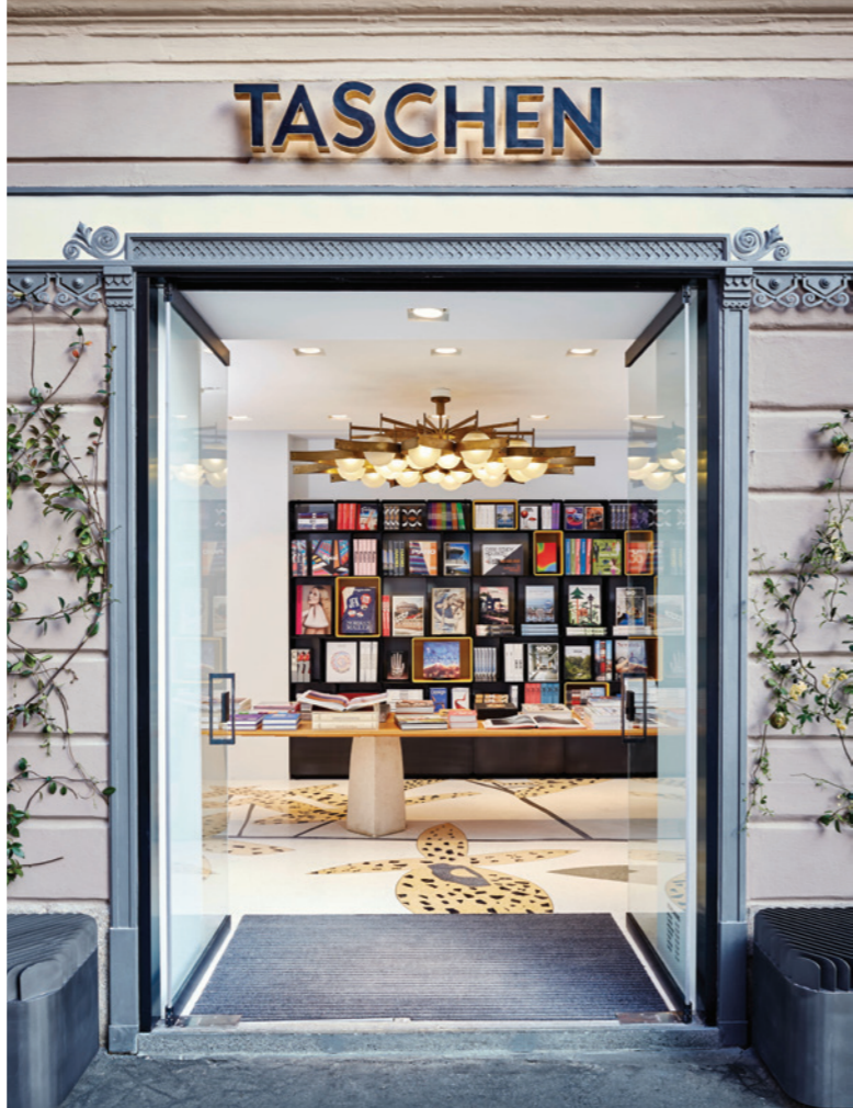
A entrada da loja, na Via Meravigli, e detalhes da escada e do piso assinado por Jonas Wood: cenário felliniano