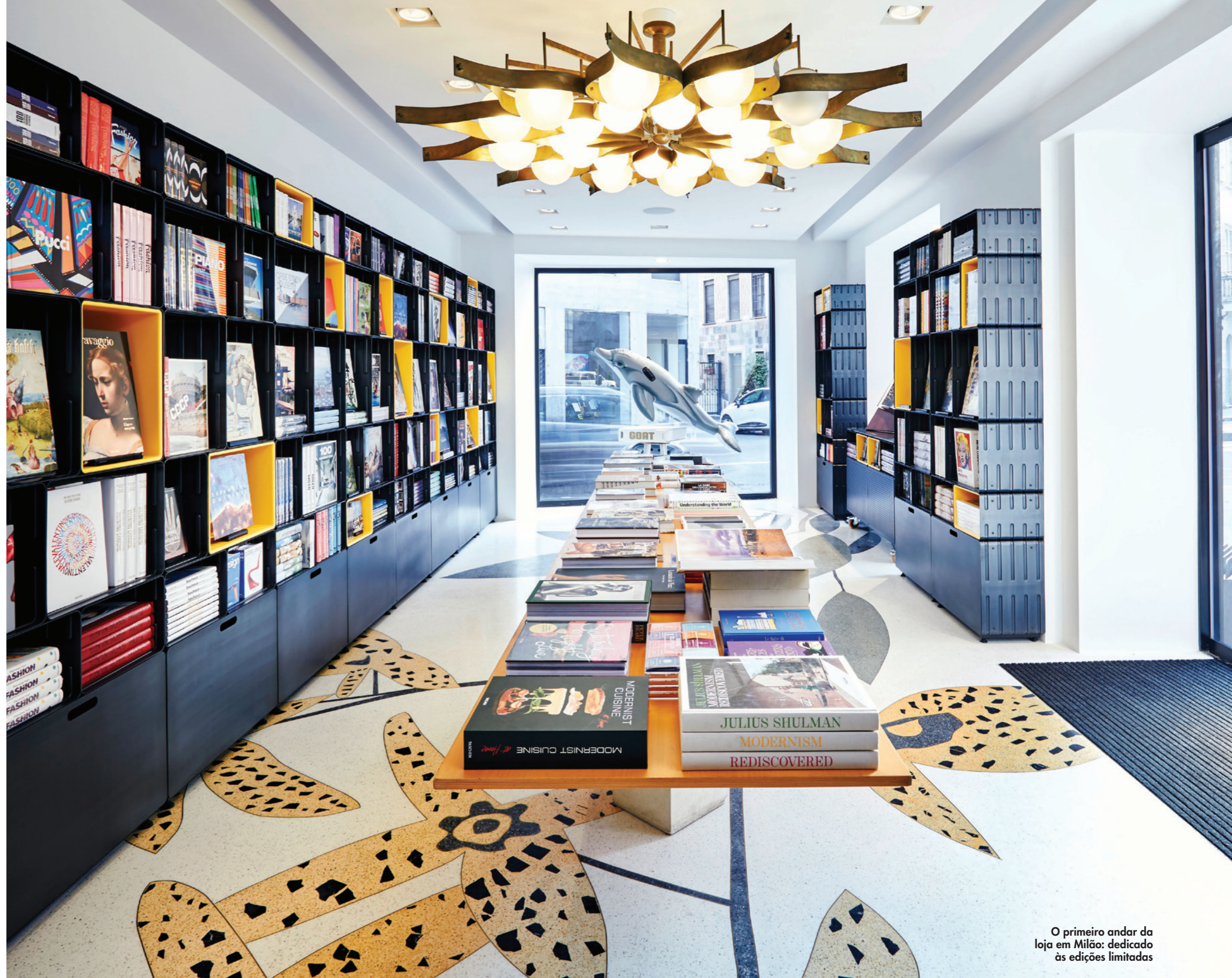
O primeiro andar da loja em Milão: dedicado às edições limitadas

Entre os dois, a colorida escadaria de Salvatore Licitra e peças da coleção pessoal de Benedikt Taschen, que concebeu a editora na Alemanha em meados dos anos 1980 – entre elas um imponente lustre de Gio Ponti, um abajur de Archimede Seguso e uma mesa de Angelo Mangiarotti – dão ao local a elegante aura dos anos 1950 da Itália. Fiel à personalidade multicultural e ao compromisso ▶